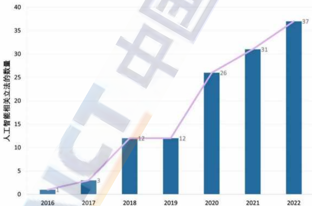
图 3 2016-22 年 81 个选定国家立法程序中提及人工智能的次数